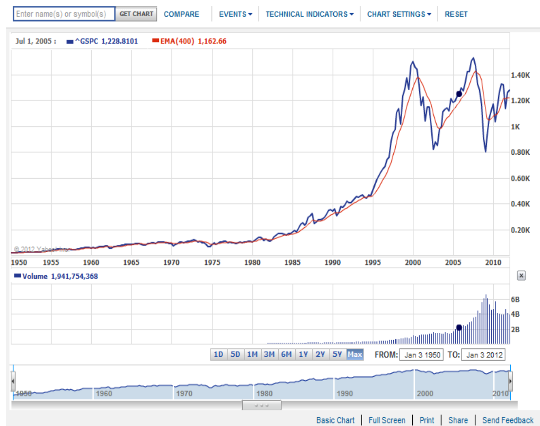
Slika 3 S&P 500 i MA400 (www.Yahoofinace.com, 2012.)