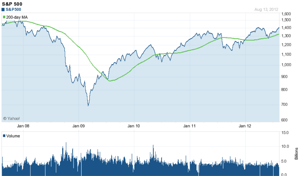
Slika 2 S&P 500